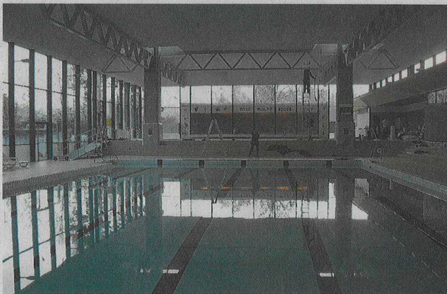
... und schon ist sie weg.